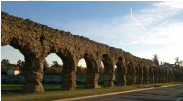
La ligne d'arches de l'aqueduc du Gier au Plat de l'Air, à Chaponost