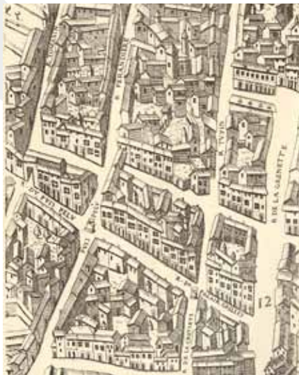
Emplacement du puits Pelu Plan scénographique de 1550