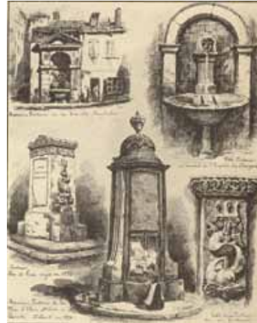
Quelques fontaines du début du XIX e siècle Dessin de Drevet in E. Vingtrinier, Le Lyon de nos pères , hors texte.