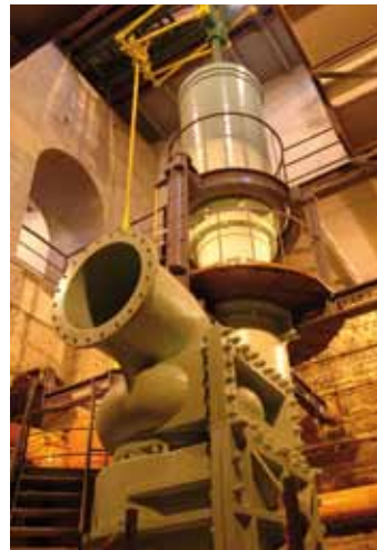
La pompe de Cornouailles