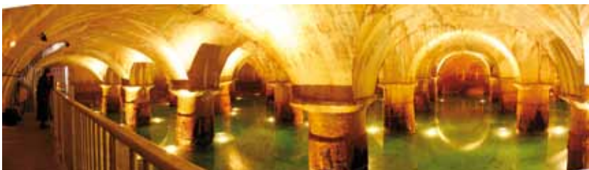
Saint-Clair, un bassin filtrant